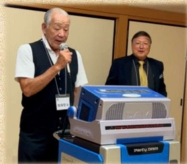
二次会 カラオケも盛り上がり